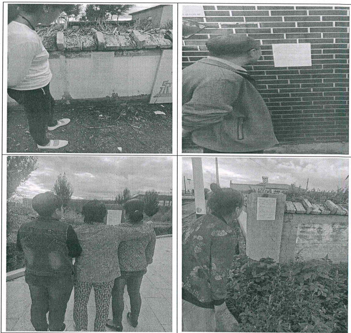
图5 第二次张贴公示现场照片

突泉县突泉镇禹禾节水灌溉设备厂于2021年8月20日~2021年9月3日在项目拟建厂址周边3.0km范围内村庄张贴公告,对项目环境影响评价信息进行了第二次公示,公示现场照片详见图5。