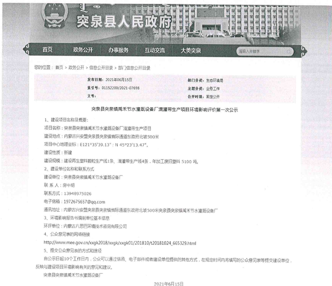
图1 第一次公示（网络）照片

突泉县突泉镇禹禾节水灌溉设备厂于2021年6月15日在突泉县人民政府网站（ http://www.tq.gov.cn/tq/zwgk25/zwgkml/bmxxgkml97/4283590/index.html ）上对项目环境影响评价信息进行了第一次公示，公示网络截图详见图1。